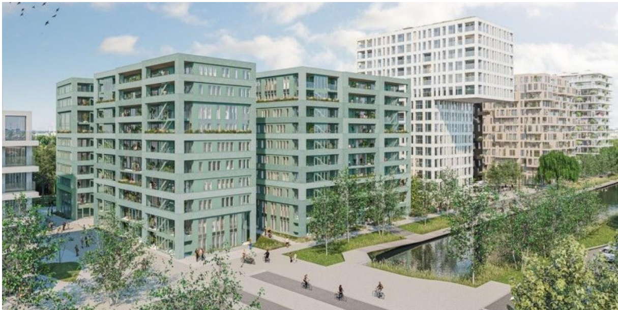
De woningen op kavel 2B